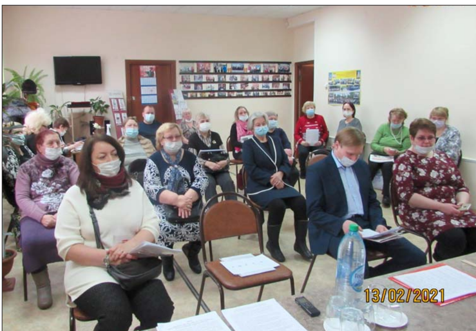
Отчётно-выборная конференция Дзержинской РО ВОИ

Двенадцать панно, созданные посредством ткани и ниток, мастерски интерпретируют оригинальное творчество современной художницы. Предельно декоративные картины Карлы Жерар сложно отнести к какому-то одному жанру. Обычно их позиционируют как примитивизм или абстракцию. Сама же художница считает, что рисует скорее в фолк-абстрактной манере. Изображенные с детской наивностью и непо-