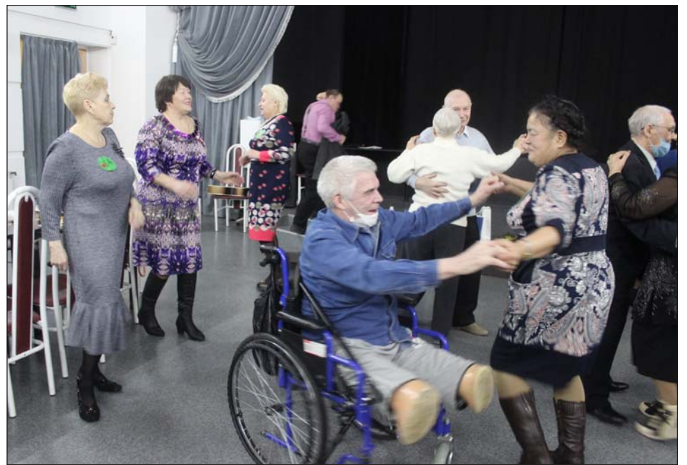
Праздничный вечер, посвящённый Дню защитника Отечества и Международному женскому дню

— И сейчас я хочу от лица нашего коллектива поздравить наших дорогих мужчин, наших верных защитников, потому что в первую очередь они — защитники своей земли, своей семьи, потому что наша великая Родина как раз состоит из семей. Дорогие мужчины! Крепкого