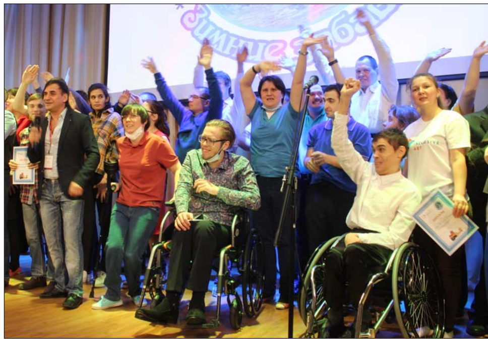
В Областном центре реабилитации инвалидов прошел первый в этом году творческий фестиваль

«Фестиваль — это самая лучшая форма творческого мероприятия для наших ребят, когда нет победителей, нет призовых мест, а есть дружба. Почти год из-за пандемии мы не выходили в люди, и вот снова все встретились, многие повидели своих давних знакомых, близких по духу людей», — отметила руководитель и мама одного из ребят молодежного клуба «Парус