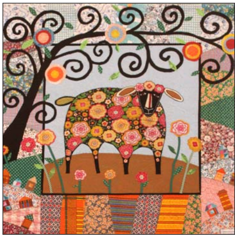
Гребенко Ирина Юрьевна Панно «Под деревом»

средственностью городские и сельские пейзажи, люди и животные повествуют о красоте мироздания. Возникающие под влиянием интуитивных впечатлений и подсознательных ассоциаций образы, гибкая графичность линий и их продуманная случайность, лёгкость и кажущаяся простота изображённого, локальность ярких цветов и их контрастное расположение идеально легли в сложносочиненную плоскость лоскутных картин. Подобные произведения искусства, позволяющие подробно, и в то же время своеобразно передавать одну изобразительную технику с помощью других технических средств, особенно ценят опытные мастера лоскутного шитья, находящиеся в постоянном поиске источника вдохновения.