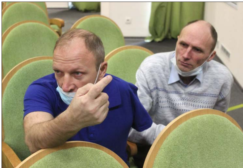
Председатели местных организаций СОО ВОИ — участники семинара

Проблемы есть, они препятствуют не только реализации избирательных прав, но и в целом осложняют жизнедеятельность граждан являющихся инвалидами. Неприспособленность большей части жилищного фонда для передвижения инвалидов-колясочников, отсутствие достаточной транспортной инфраструктуры, конечно, становится препятствиями и в дни голосования.