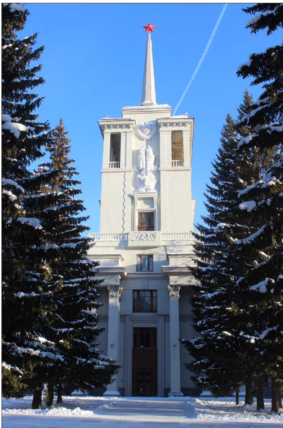
В декабре 2021 года, накануне дня рождения Иосифа Сталина, барельеф вождя вернулся на башню Дома офицеров