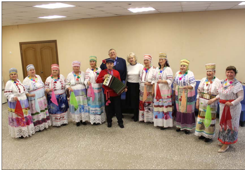
Многие организаторы знают, что наши певуны могут стать украшением любого фестиваля