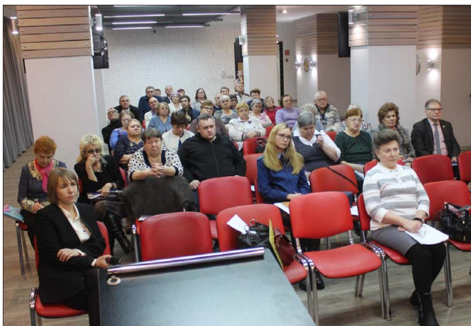
Участники семинара СОО ВОИ

Ну вот, наверное, всё. Там дальше представлена уже разбивка по санаториям. Всё не буду озвучивать, и так уже много времени. Поэтому, если есть вопросы, уважаемые участники, мы ответим.