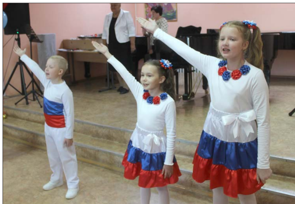
Хор «Эдельвейс» исполняет песню «Широка страна моя родная»