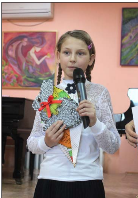
«Зайчик» от детей Центра