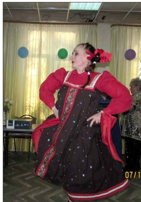
«Мы все таланты!»