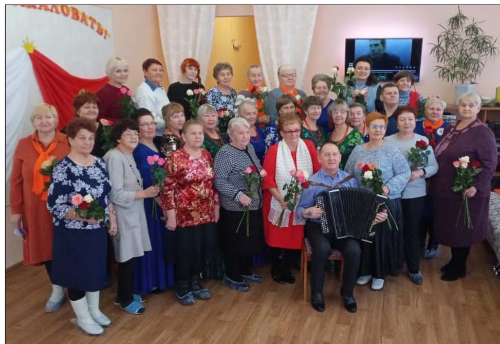
Тёплый приём гостей из ВОИ