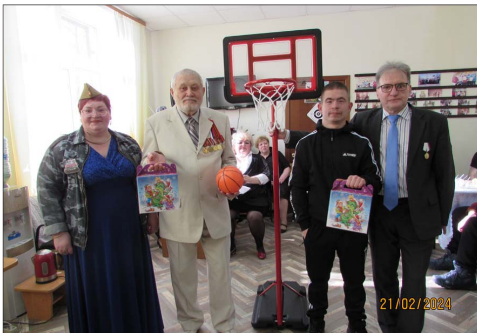
В упорной борьбе прошёл главный конкурс «Мяч в корзину»

Евгений Арбенив Фоторепортаж на сайте http://www.coovoi.narod.ru В разделе «Новости»