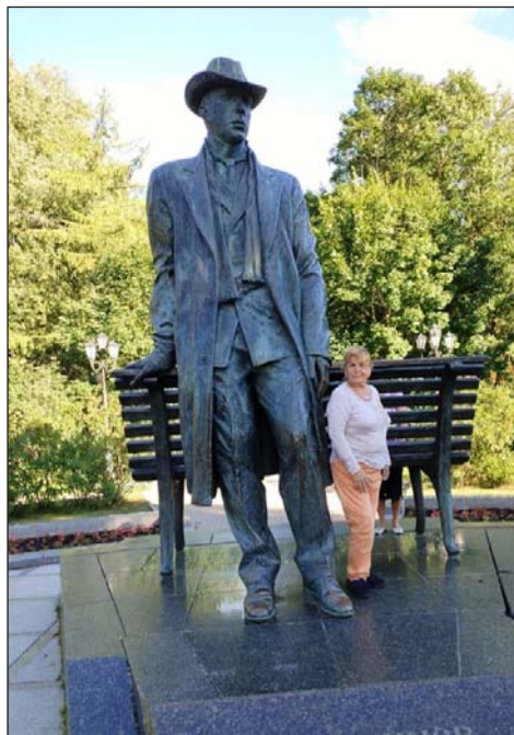
Памятник композитору Сергею Рахманинову, родившемуся в Новгородской губернии

Великий Новгород с населением чуть больше 200 000 тысяч человек, площадь 90 кв.км. Древний русский город, впервые упомянутый в летописи в 859 году, хранитель вековой истории. Река Волхов делит город на две части: Софийскую и Торговую стороны. Софийская сторона получила название от старинного Софийского собора, которому 1000 лет, здесь находится основная часть города, Новгородский