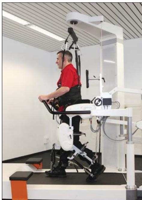
Тренажёр «Роботизированная локомоторная терапия»

Предусмотреть для обслуживания инвалидов-колясочников Портативную доску BeasyTrans с вращающимся сиденьем для пересаживания пациента из кресла-коляски в кровать и обратно.