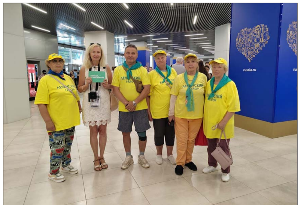
Международная выставка-форум «Россия» на ВДНХ