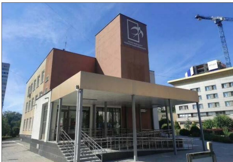
Областной центр реабилитации инвалидов

Обеспечить Центр Эвакуационным стулом «Самоспас» для эвакуации маломобильных групп населения по лестнице.