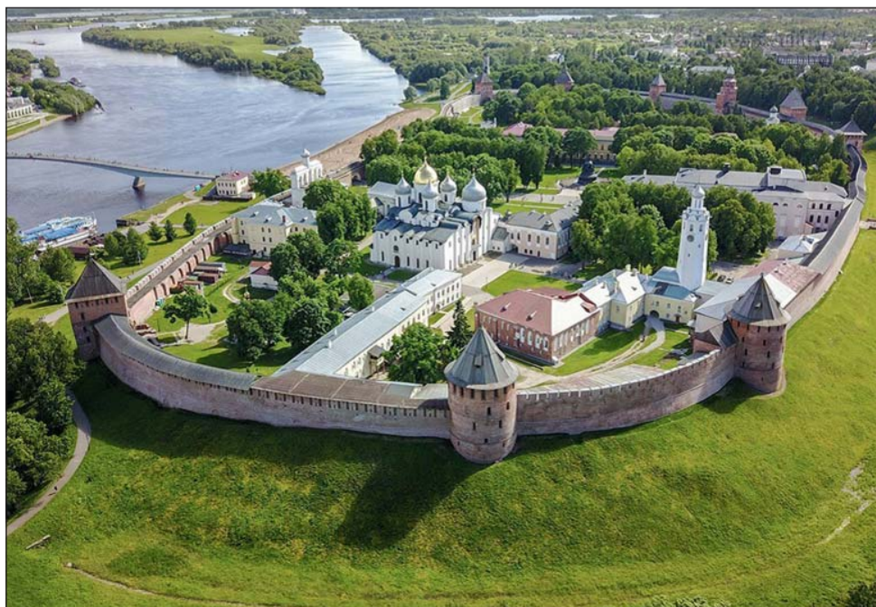
Новгородский Кремль, или Детинец, как его называли в древности

В Великом Новгороде много всего интересного и самобытного.