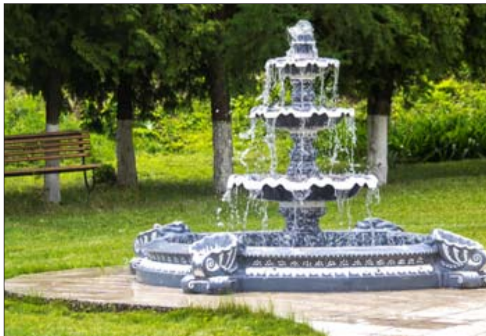
Многие из пациентов с удовольствием отдыхали бы у фонтана

Территория Центра довольно обширная, достаточно разумно и элегантно оборудована.