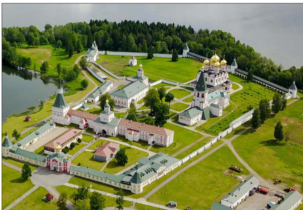
Валдайский Иверский мужской монастырь