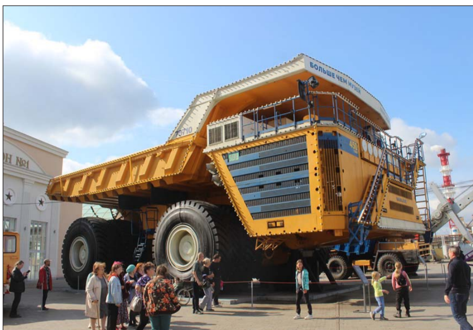
Карьерный самосвал БелАЗ-75710

— Мне понравились танки, вертолёты, военная техника всякая, пушки.