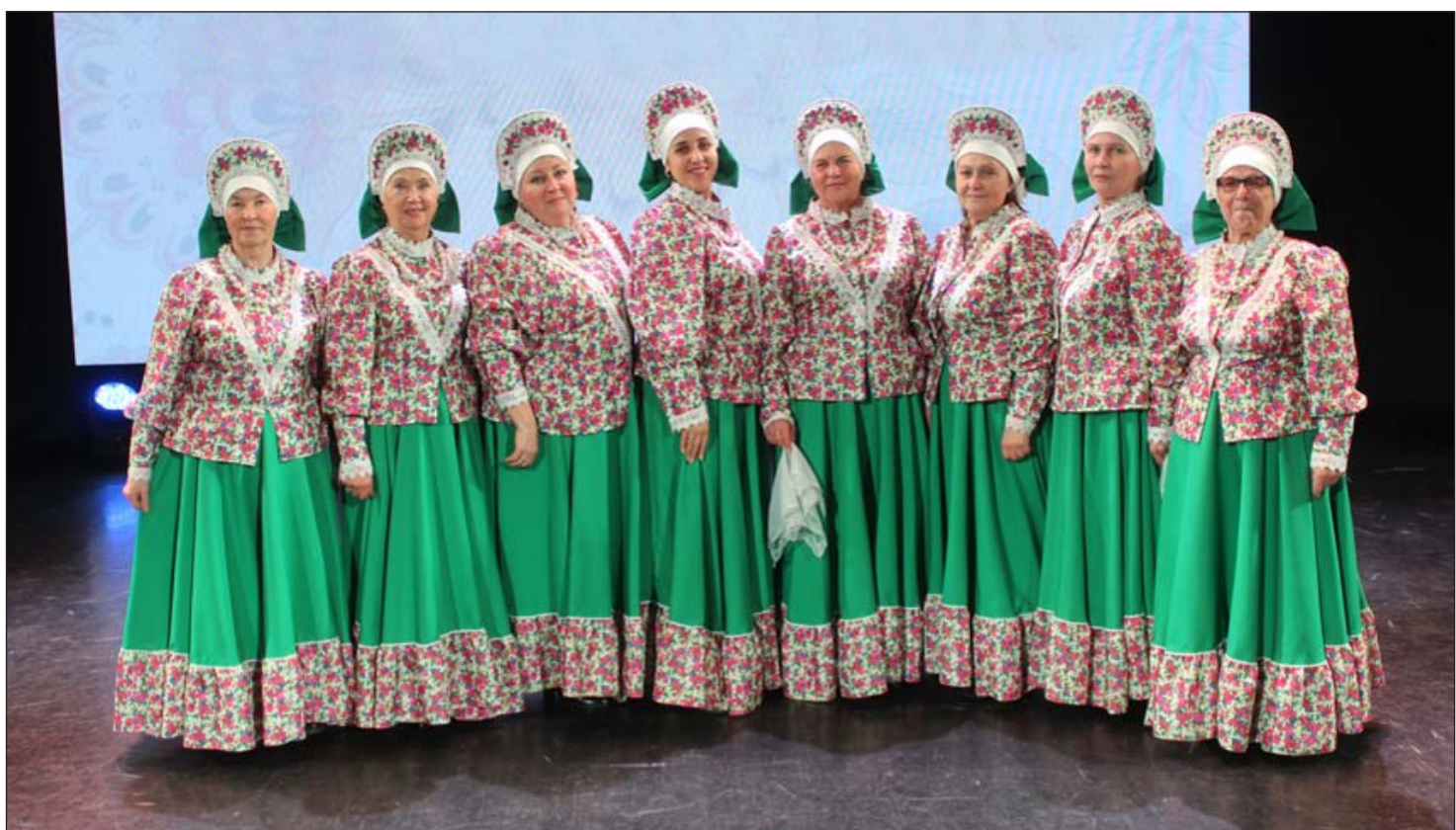
Лауреат I степени — победитель конкурса: Хор «Любава» — Октябрьская ПО ВОИ Сысертской РО ВОИ

Подготовил Евгений Арбнев Фоторепортаж и протокол турнира — на сайте http://www.coovoi.narod.ru в разделе «Новости»