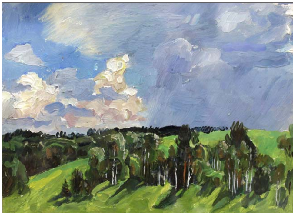
Геннадий Мосин. Этюд к картине «После грозы». 1976

Итогом творческой деятельности Геннадия Мосина стали две персональные выставки, прошедшие в Свердловске (ноябрь 1981 года) и в Москве (январь 1982 года). Накануне первой выставки ему было присвоено звание Заслуженный художник РСФСР.