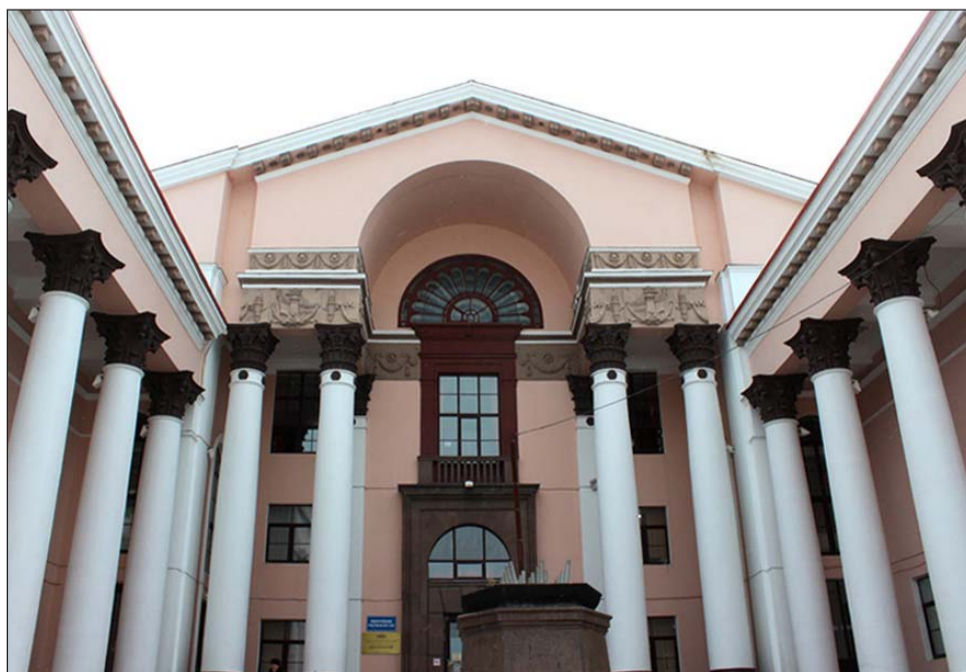
Центр культуры и искусств «Верх-Исетский»

Подготовил Евгений Арбнев Фоторепортаж на сайте http://www.coovoi.narod.ru в разделе «Новости»