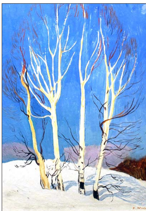
Геннадий Мосин. Берёзы. 1979

Полностью прослушать данную беседу можно по ссылке https://disk.yandex.ru/d/N9lzyMxTp8sJOA