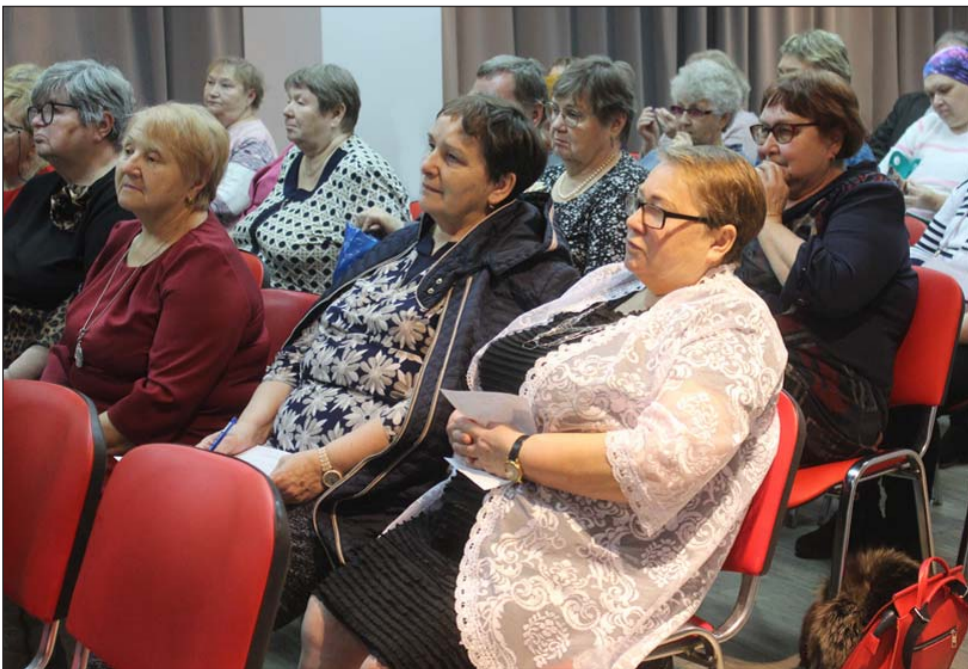
Участники семинара и Пленума правления

3 декабря в МО ВОИ мы провели чаепитие. Нас пришли поздравить: председатель Думы ГО Богданович